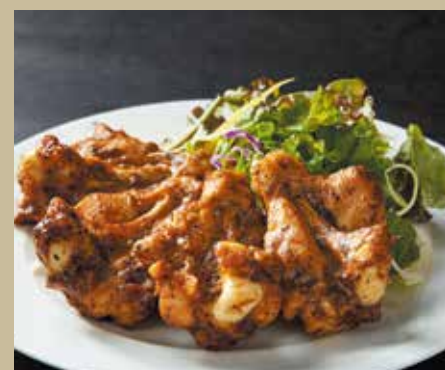
手羽元黒胡椒焼き ¥1,250