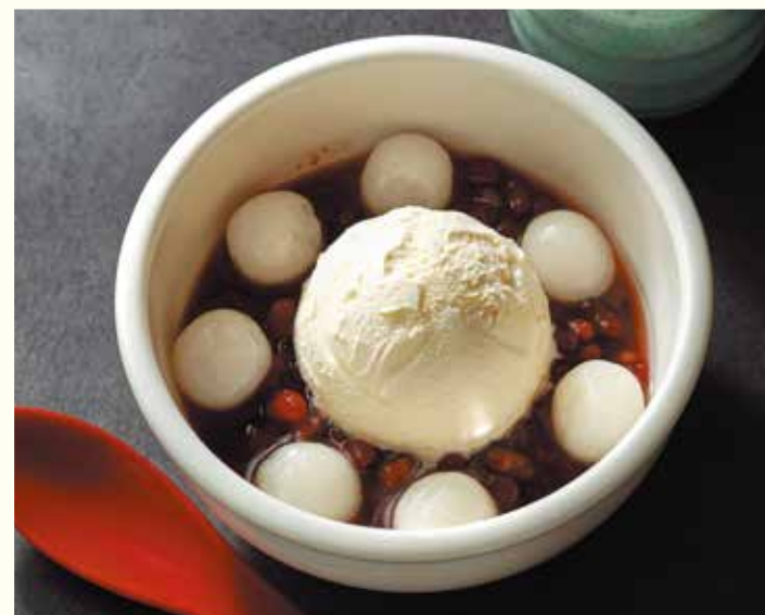
Chilled Zenzai with Siratama

北海道産の粒あんに、歯触りの良い寒天、口溶けなめらかなバニラアイスクリーム、もちもちの求肥を合わせた、男性のお客様にも好評な甘味です。コクのある黒みつも後味はすっきり。食後感が爽やかなことも人気の理由です。