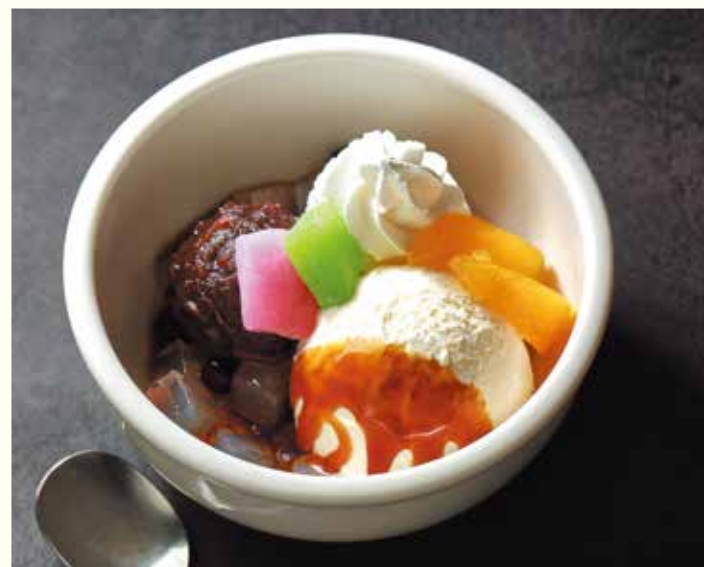
Anmitsu Agar with Ice Cream

ふんわり口溶けのいいスポンジを中心に、国産和栗のなめらかなペーストをたっぷり絞った定番のモンブラン。和栗ならではのやさしい風味がたまりません。生クリームやフルーツソースと合わせてお楽しみください。