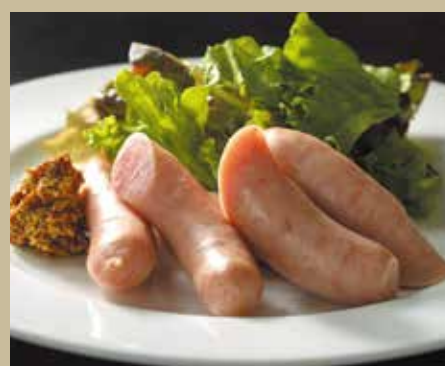
イベリコソーセージ ¥1,000