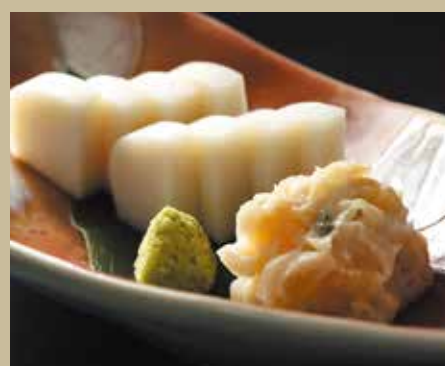
板わさ 数の子山葵和え ¥700