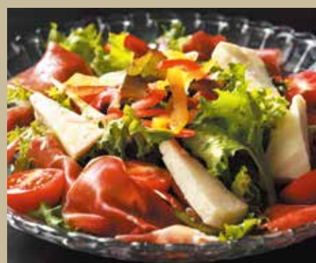
生ハムとチーズのサラダ ¥1,400