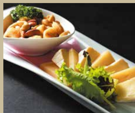
笠間産チーズ&ナッツ ¥1,400