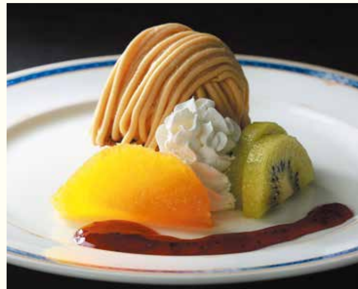
Mont Blanc Cake

しっとり・ふわふわに焼き上げたスポンジ生地で、ミルクィなクリームをたっぷり巻いた、リッチなロールケーキです。口の中にスッと消えていく軽い食感で、穴戸ヒルズのおみやげとしても人気の一品です。