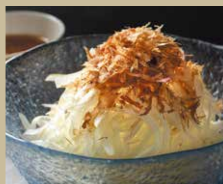
オニオンスライス ¥660