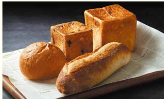
Premium Bread Gift Assortment

しっとり・ふわふわに焼き上げたスポンジ生地で、ミルクィなクリームをたっぷり巻いた、リッチなロールケーキ。口の中にスッと消えていく軽い食感が後を引く、老若男女に人気の一品です。