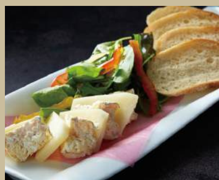
笠間産チーズ&バゲット ¥1,200