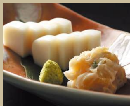
板わさ 数の子山葵和え ¥700