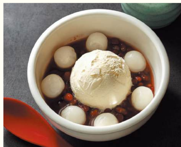
Chilled Zenzai with Siratama

北海道産の粒あんに、歯触りの良い寒天、口溶けなめらかなバニラアイスクリーム、もちもちの求肥を合わせた、男性のお客様にも好評な甘味です。コクのある黒みつも後味はすっきり。食後感が爽やかなことも人気の理由です。