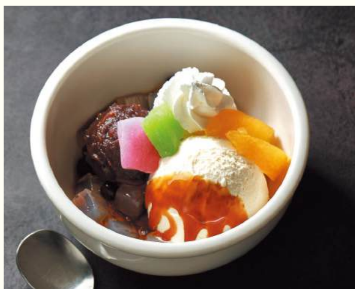
Anmitsu Agar with Ice Cream

サクッと軽いタルト生地に、酸味と甘みのバランスの良いりんごを並べて焼き上げたシンプルなタルトをデザートプレートに。ほんのり温かい状態でりんごの風味を楽しんでいただけます。お好みでホイップクリーム、フルーツソースをつけてどうぞ。