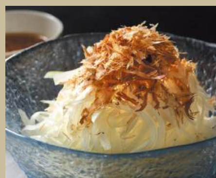
オニオンスライス ¥660