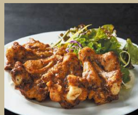
手羽元黒胡椒焼き ¥1,250