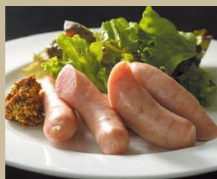
イペリコソーセージ ¥1,000