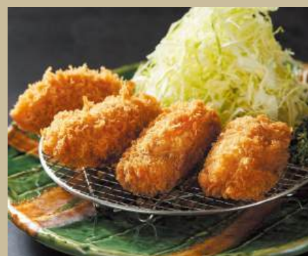
広島産カキフライ(4個) ¥1,300