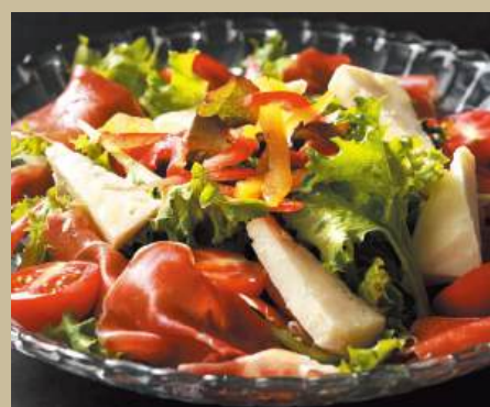
生ハムとチーズのサラダ ¥1,400