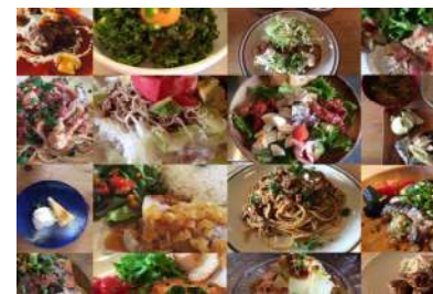
TODAY'S SPECIAL DISH Ask

静岡とは、ラーメン二郎をこよなく愛すNONAMECAFEオーナーが静岡ヒルズ店限定で作上げた二郎インスパイアラーメンです。納得した日にしか出てこないメニューです。あればラッキー。ニンニク入れますか？