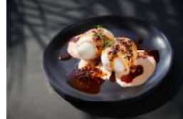
EXQUISITE EGGS 650