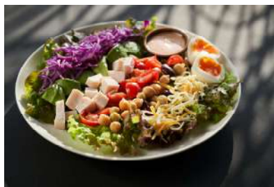
COBB SALAD 1,700

ニッカウヰスキーでフランベし、風味をプラスした柔らかなでジューシーなリブローズを、オリジナルオニオンソースで。地元新鮮サラダ、オリジナルドレッシング付き。