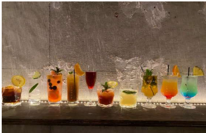
TODAY'S SPECIAL DRINK Ask

バーテンダーが厳選したその日だけのスペシャルドリンク。ワイン、テキーラ、焼酎(芋・麦)、スペシャルドリンク各種取り揃えております。詳しくはスタッフまで。