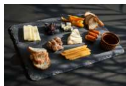
ASSORTED CHEESE 1,650