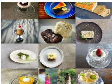
CHEF'S WHIMSICAL DESSERT Ask