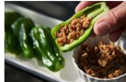
GREEN PEPPER 750