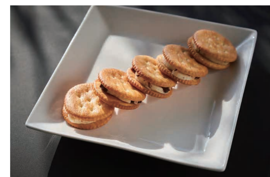
FIG BUTTER SAND 500